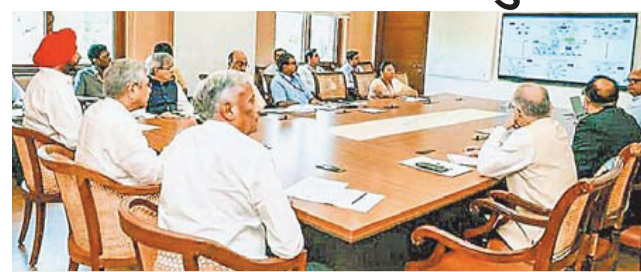
दिल्ली के रेल भवन में बैठक लेते रेलमंत्री अश्विनी वैष्णव

रेल मंत्री ने दिए सभी जोनल अधिकारियों को निर्देश