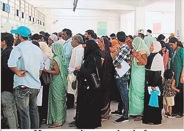
हमीदिया अस्पताल में इलाज कराने पहुंचे मरीज।

एम्स के चिकित्सकों ने जारी शोध में बताया कि भोपाल में 1984 में गैस त्रासदी के बाद फेफड़ों के मरीजों की संख्या में 30 से 35 फीसदी वृद्धि हुई है। भोपाल की हवा में धूल के कण 5 से 10 माइक्रोमीटर के होते हैं। ये फेफड़े और दिल तक पहुंच जाते हैं। इस वजह से फेफड़ों के मरीज बढ़ रहे हैं। वर्ष 2017-18 की तुलना में 2025 तक हृदय की बीमारियों के मामले लगभग तीन गुना बढ़ गए हैं। ग्रामीण क्षेत्रों की तुलना में शहरी क्षेत्रों में हृदय रोगियों की संख्या अधिक है। उम्र को देखे, तो 40 वर्ष से कम उम्र के युवा उम्र दोनों रोगों से सर्वाधिक पीड़ित हैं। गर्मियों में भी हार्ट और फेफड़ों के मामले अधिक आ रहे हैं।