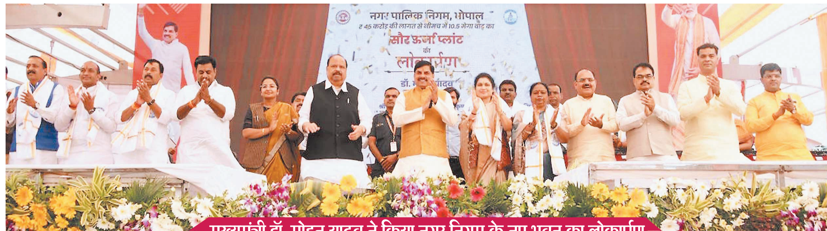
मुख्यमंत्री डॉ. मोहन यादव ने किया नगर निगम के नए भवन का लोकार्पण